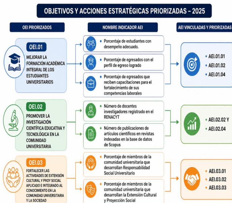
Gráfica 02 Objetivo, Estrategias e Indicadores Priorizados en el periodo 2025