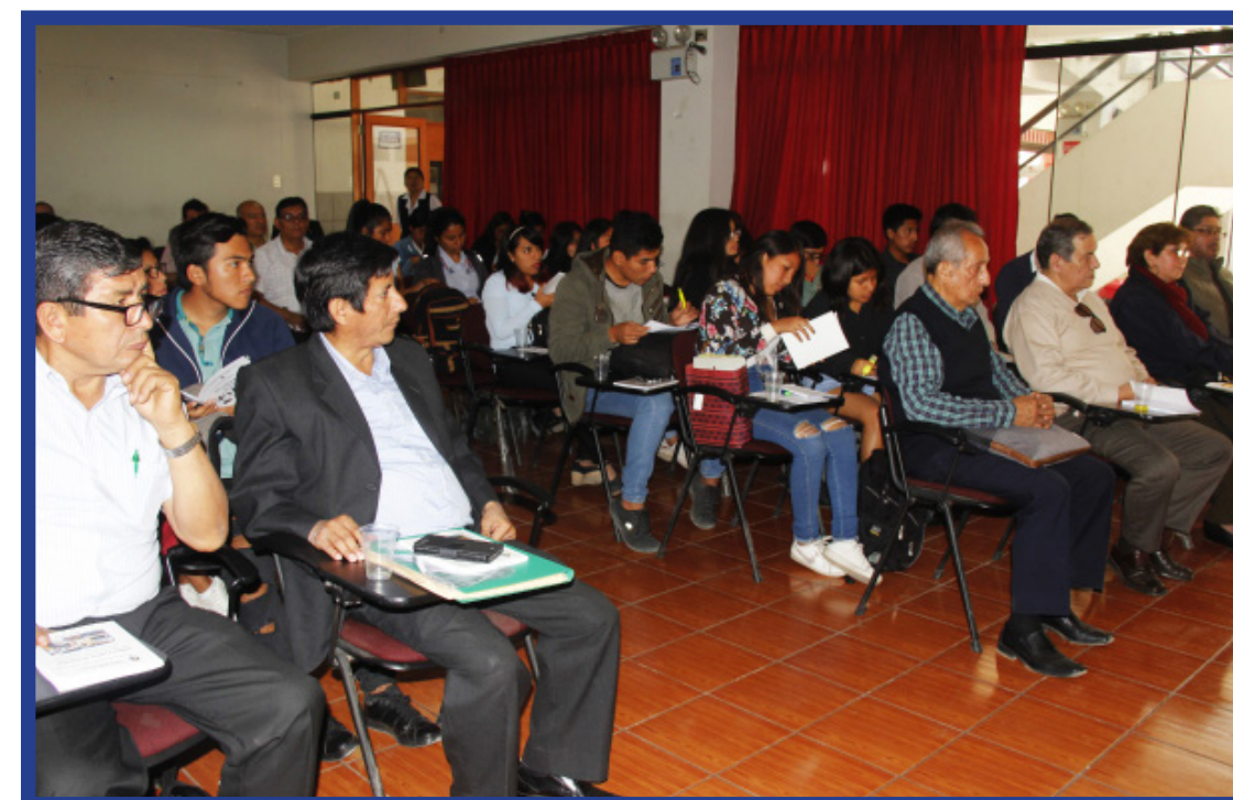
Docentes expresaron su satisfacción por la publicación del directorio de la Facultad de Ciencias Sociales y Humanidades.