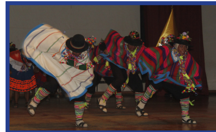
CAFUNE presente en las celebraciones.