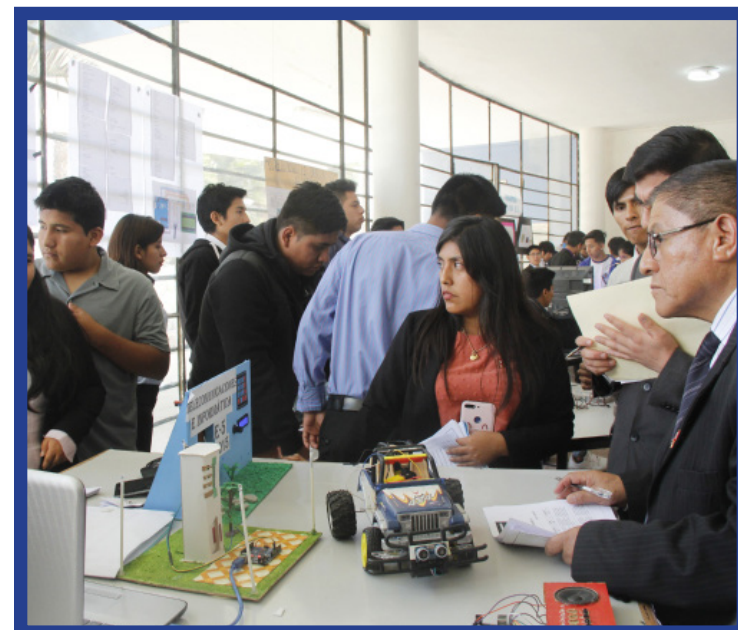
El decano de Tecnología integró el jurado que calificó los trabajos desarrollados por los estudiantes.

Participaron 241 docentes de esta casa superior de estudios