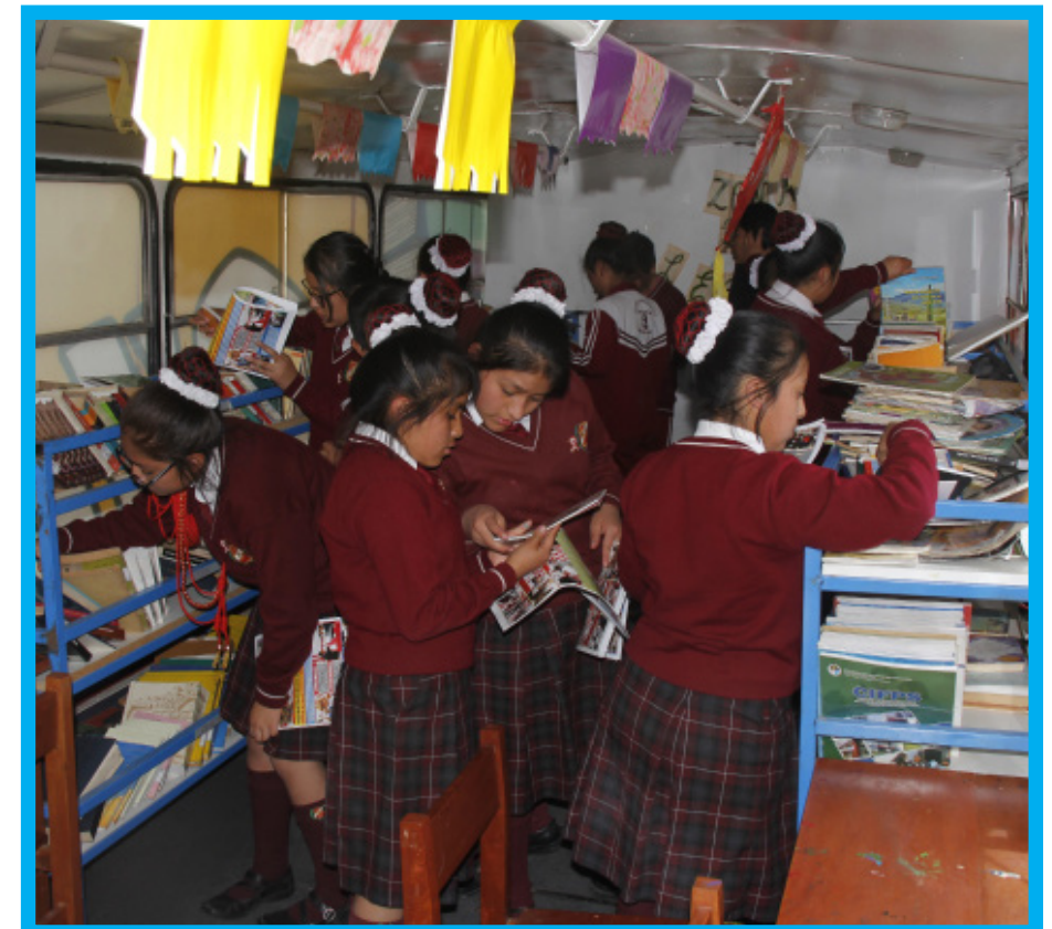
En el interior del Bibliobús, los niños encontraron una gran variedad de libros, especialmente cuentos de importantes autores.