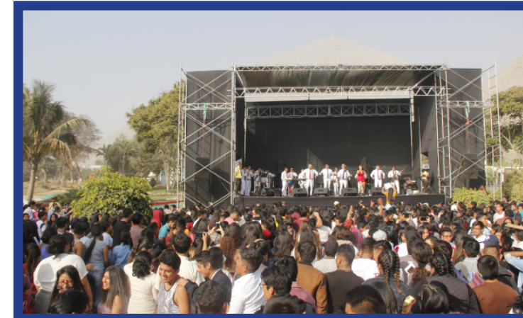
Orquesta Internacional Kaliente, con lo mejor de su música.