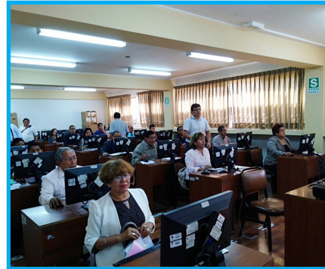
Los docentes fueron capacitados por los especialistas de la Oficina de Tecnologías de la Información.

Agropecuaria y Nutrición se llegaron a capacitar a 21 docentes, en la Facultad de Ciencias 62 docentes, en Ciencias Sociales y Humanidades a 61, Educación Inicial 13, Pedagogía y Cultura Física 43, y en la Facultad de Tecnología a 41 catedráticos.