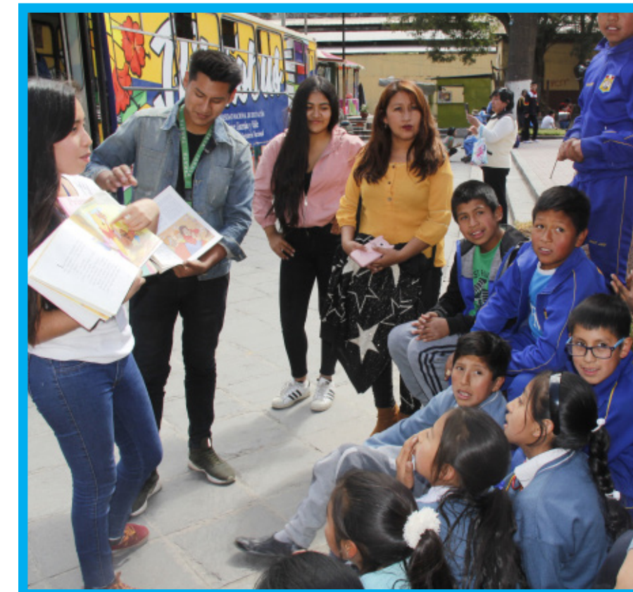
Los jóvenes voluntarios desarrollaron un interesante programa que permitió que los niños se interesaran por la lectura.