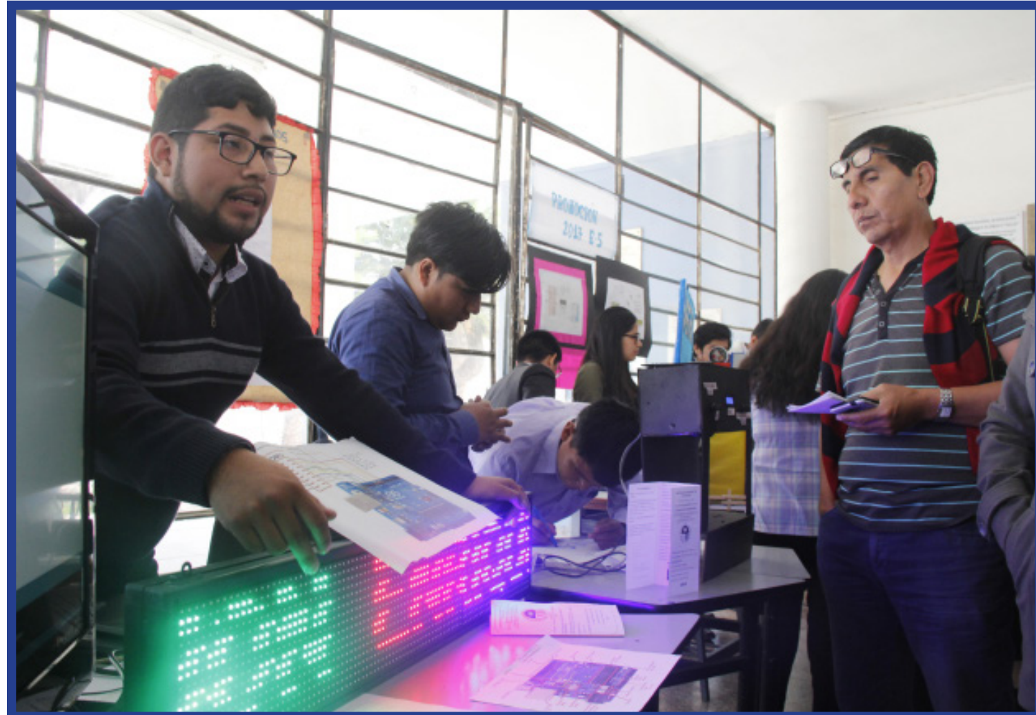
Trabajos que apuntan a convertirse en un futuro como soluciones tecnológicas aplicadas en el quehacer diario, para el hogar, en las empresas y en centros de labores.

Así se pudo apreciar innovadores trabajos que apuntan a convertirse en un futuro como soluciones tecnológicas aplicadas en el quehacer diario, para el hogar, en las empresas y en centros de labores como: ascensor digital, elevador, , puerta de seguridad arduino, radar ultrasónico, casa domótica y cámara de seguridad, coche esquivador de obstáculos, carro espía, estacionamiento inteligente, panel publicitario con arduino y java, alimentador inteligente, entre otros. innovación