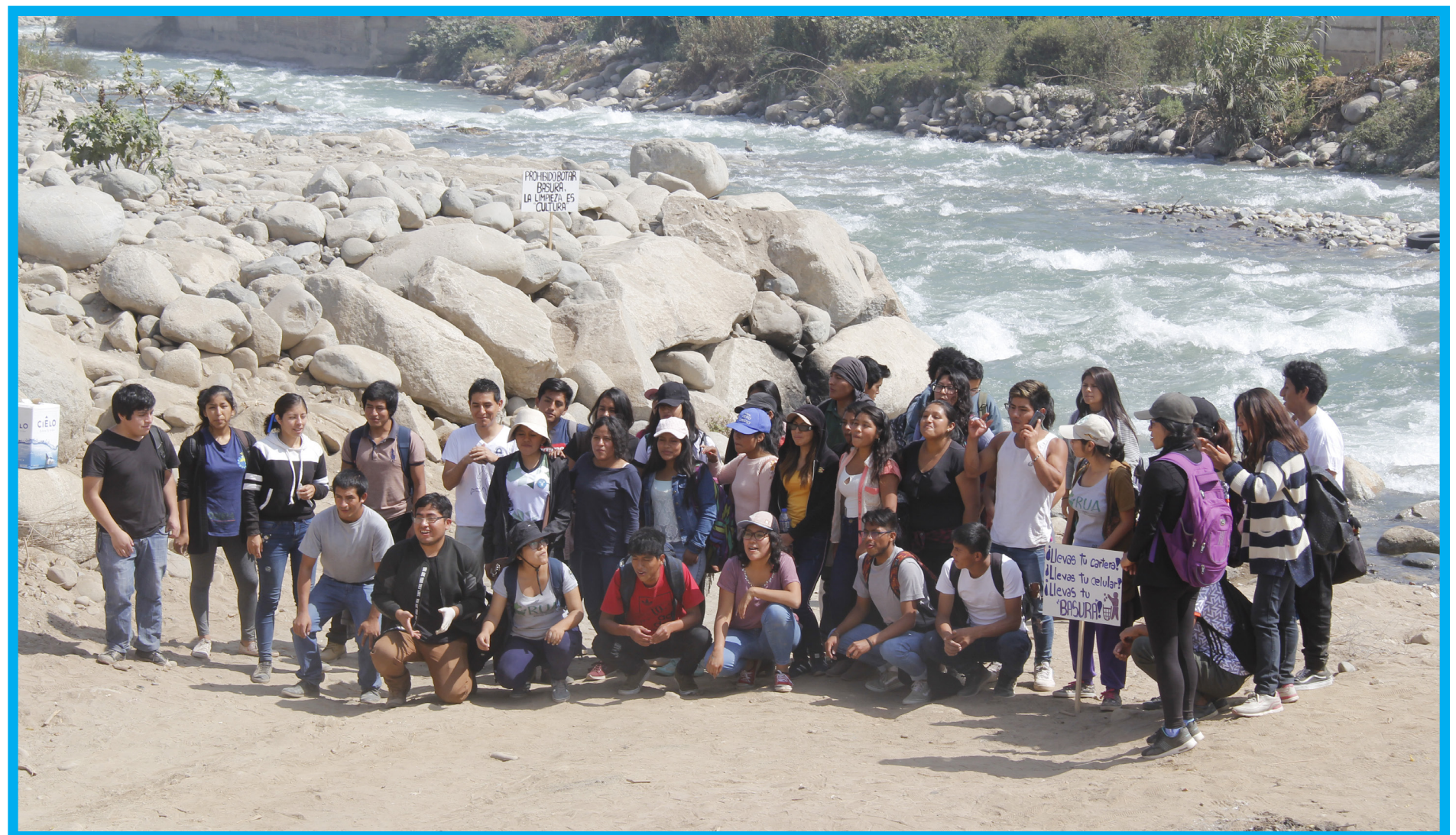
Los participantes pertenecen a la Red Universitaria Ambiental de la Universidad Nacional de Educación Enrique Guzmán y Valle, los beneficiarios de Beca Permanente y Beca 18 y estudiantes de las diferentes facultades que se sumaron a la campaña.