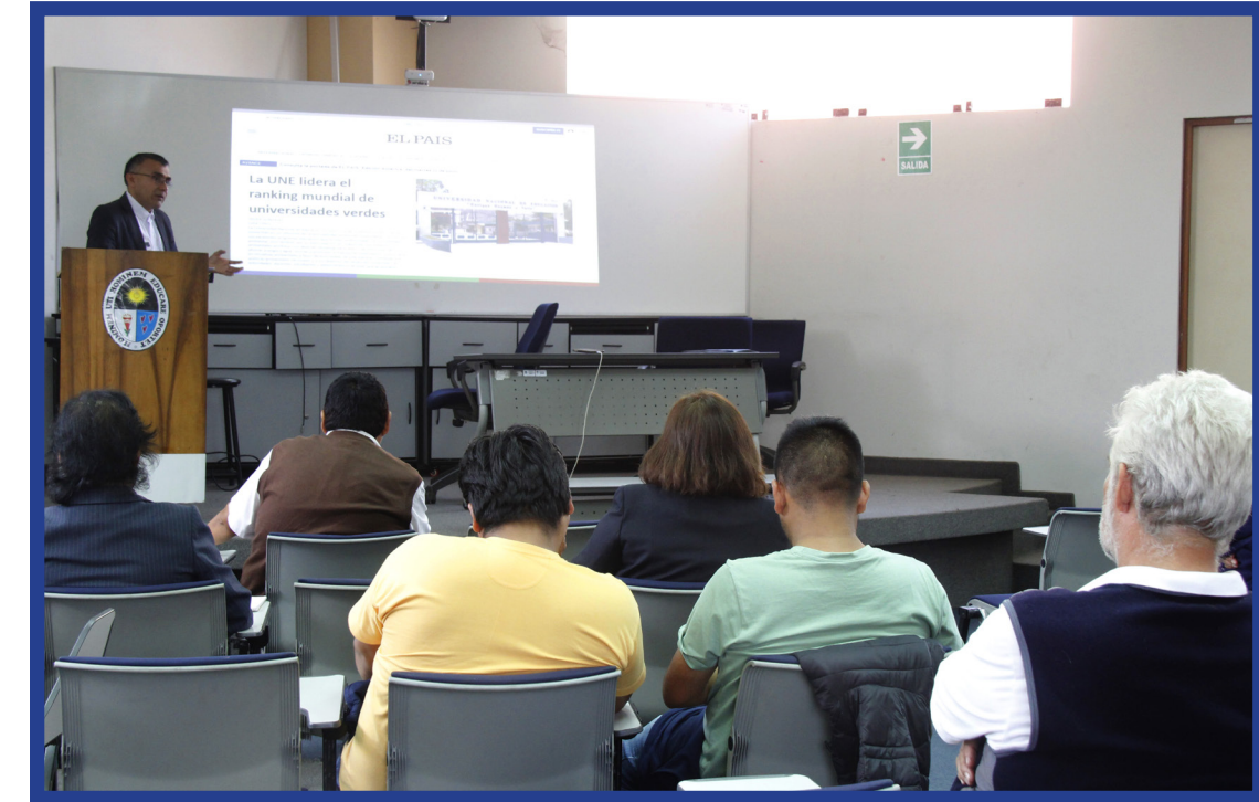
Participaron en el evento del Minam, directores académicos, funcionarios, docentes y estudiantes.

Esta actividad se realizó en el marco del proceso de licenciamiento de nuestra casa de estudios, para el cumplimiento de uno de los indicadores de las Condiciones Básicas de Calidad (CBC), Condición VI, Verificación de los servicios educacionales complementarios básicos, que pide contar con políticas, planes y acciones para la protección del medio ambiente.