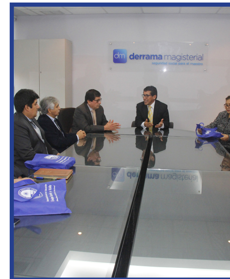
La firma del acuerdo específico se desarrolló en la sede de la Derrama Magisterial, en el distrito de Jesús María.