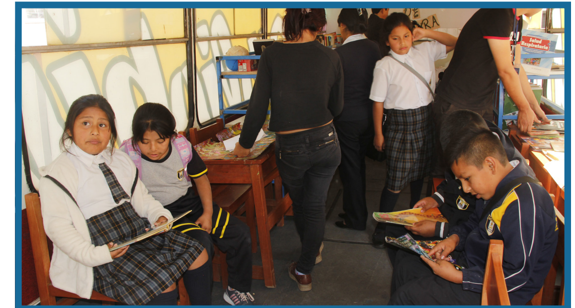
Niños dentro del Bibliobús disfrutaron de la lectura.