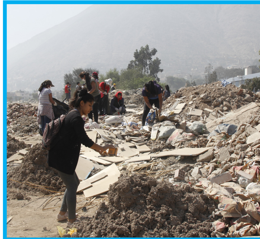
Los estudiantes de la UNE contaron con el apoyo de la Municipalidad de Chosica.