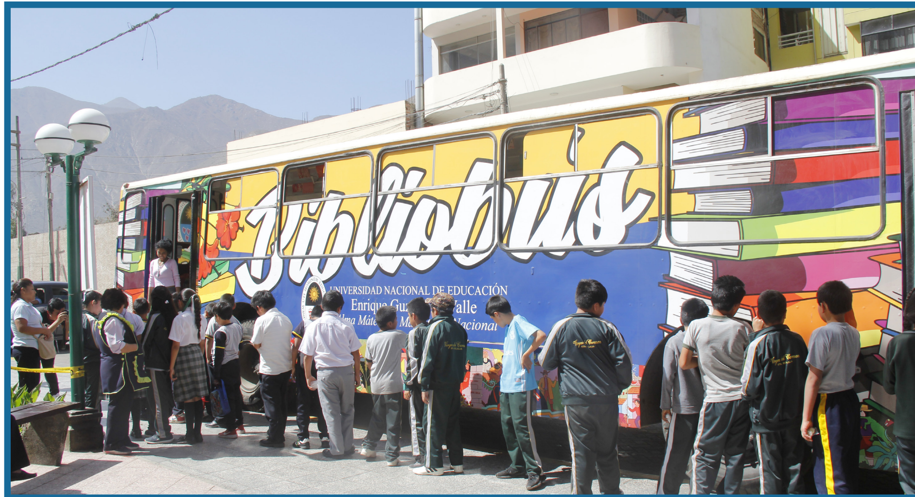
Santa Eulalia, un distrito más de la provincia de Huarochirí que se beneficia con la presencia del Bibliobús Cantuteño. Cientos de niños disfrutaron de buena lectura, teatro y presentaciones artísticas a cargo de nuestro jóvenes estudiantes voluntarios.