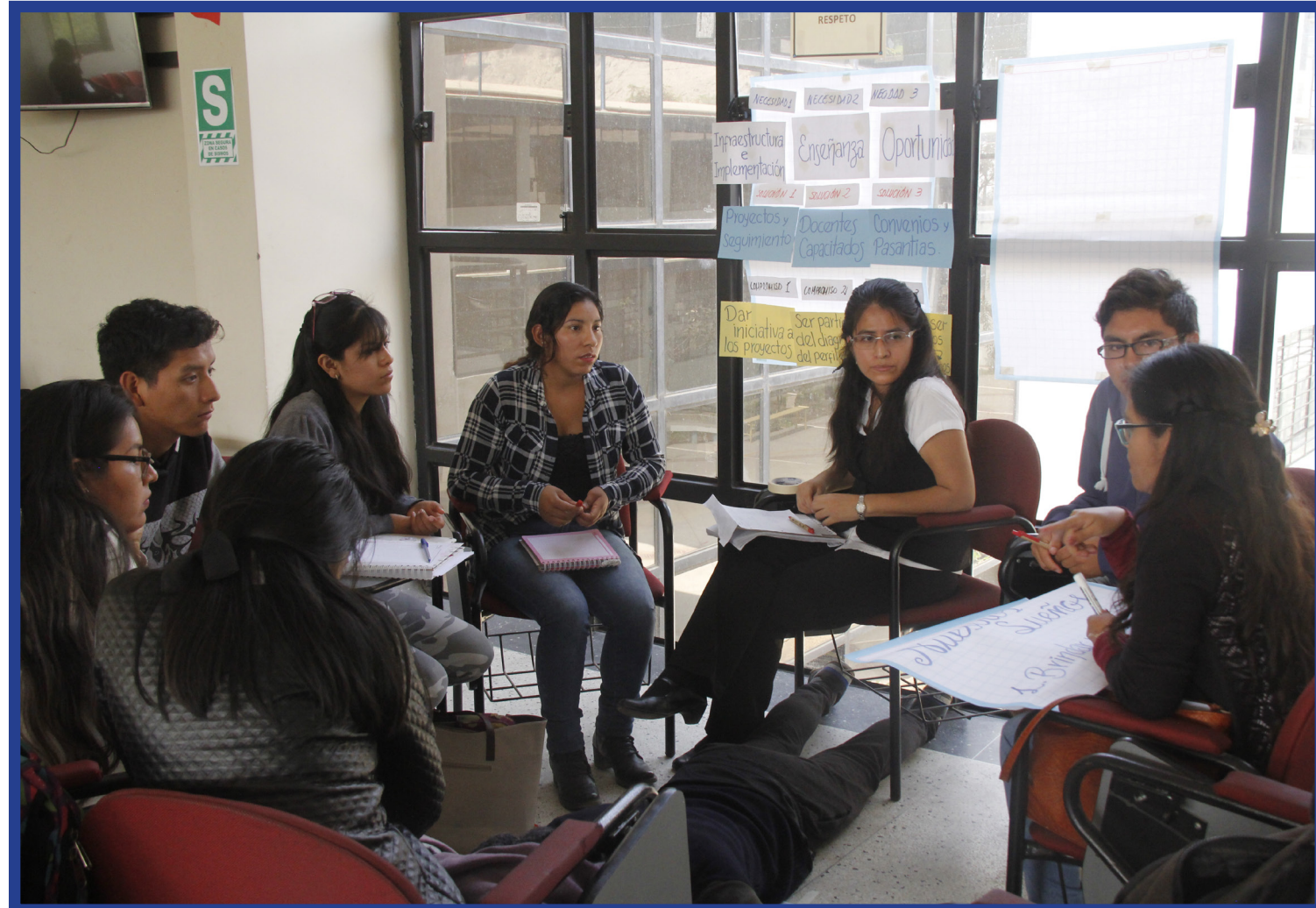
La UNE participó de las jornadas de educación con docentes y estudiantes de los primeros puestos de las diferentes facultades.

Así se han realizado las Jornadas Piloto