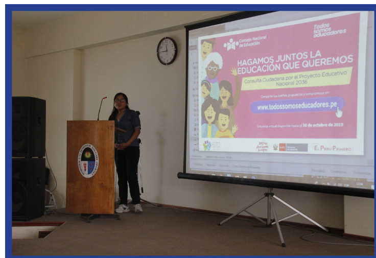
Trabajando para el nuevo Proyecto Educativo Nacional al 2036.

por la Educación el 6, 7 y 12 de junio y concluyó con una jornada el 20 de junio.