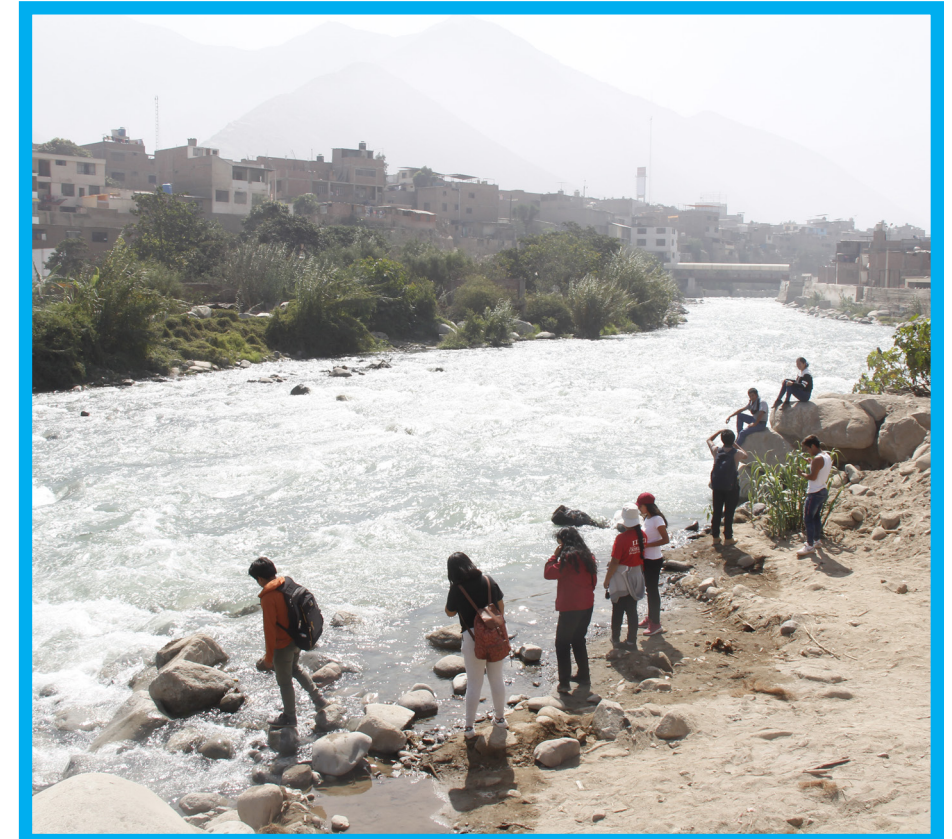
A lo largo del río Rímac se recogieron botellas y bolsas de plástico que dañan y contaminan el medio ambiente.