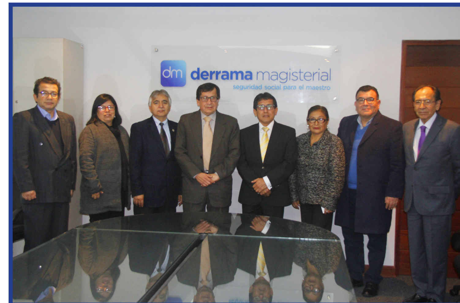
Foto oficial de las autoridades de la UNE y Derrama Magisterial, tras la firma del convenio interinstitucional que se realizó en la sede central de la institución en Jesús María.

tres (03) años a partir de la fecha de suscripción, y cualquier modificación o ampliación del convenio deberá hacerse por común acuerdo de las partes, mediante una adenda, con 45 días de anticipación.