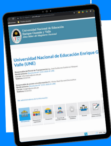
Portal de transparencia de la UNE