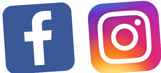
Redes sociales oficiales de la UNE