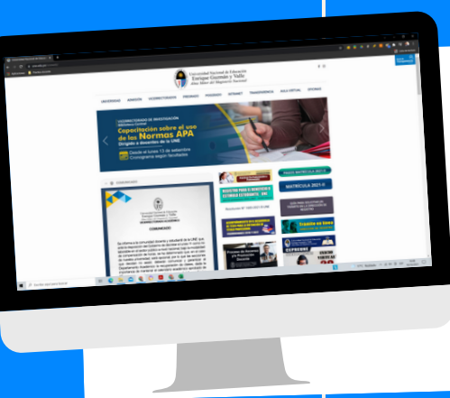
Página web de la UNE

Por este medio la universidad comunica las actividades desarrolladas en la UNE